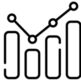
Mejorar los Resultados