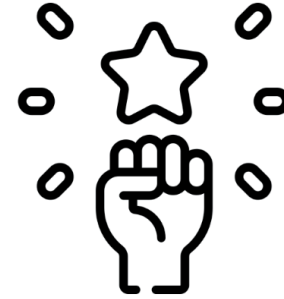
Motivación y Retención