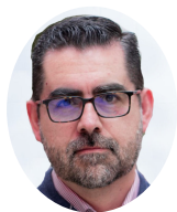
Víctor González Sperientia [studio+lab]@